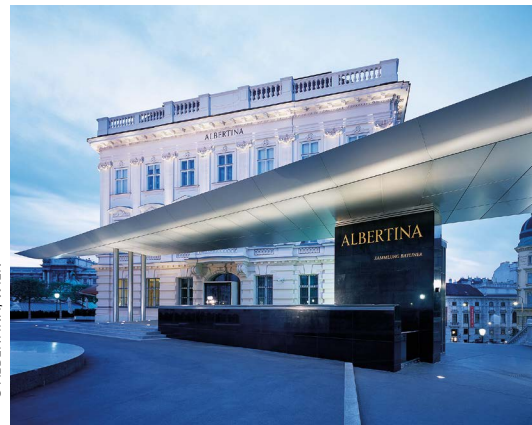
Die Albertina feiert ihr 250-jähriges Jubiläum mit vielen spannenden Ausstellungen.

Die große „Geburtstagsfeier“ findet am 4. Juli statt, mit freiem Eintritt und einer Ansprache des österreichischen Bundespräsidenten. Besonders ist auch das „Rokoko Special“ am 26. September: Wer im passenden Kostüm kommt, erhält gratis Eintritt, und auf der Terrasse der Albertina wird mit DJs und Sommerdrinks gefeiert.