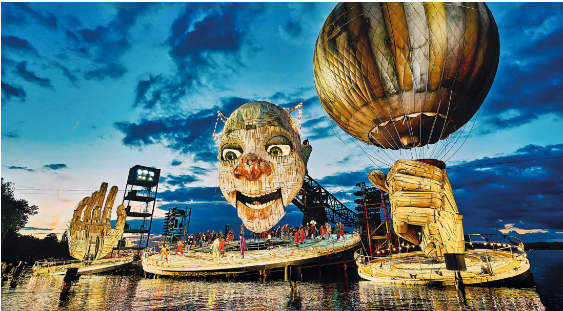
So sah die Seebühne 2019 für die Verdi-Oper Rigoletto aus. Heuer warten alle gespannt auf das neue Bühnenbild für Verdis La traviata .

2026 feiert die österreichische Kulturszene viele bedeutende Jubiläen. Museen, Festivals und Theater blicken auf eine lange Tradition zurück. Trotzdem kommen moderne Impulse in Österreich nicht zu kurz. Was die Kulturbetriebe außerdem verbindet, sind die besonderen Angebote im Jubiläumsjahr 2026.