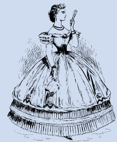
Beispiel eines Korsetts

Reformkleidung sollte freieren Bewegungsraum und Mobilität für Frauen schaffen, einengende Elemente beseitigen und symbolisch für sich verändernde Lebensbedingungen für Frauen stehen. Unterstützt wurde die