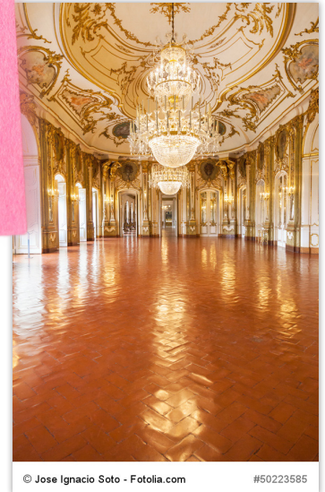
© Jose Ignacio Soto - Fotolia.com #50223585

der Adel = eine geschlossene soziale Schicht (Könige, Herzoge, Fürsten), die in Europa im 18. Jahrhundert die mächtigste war. 1919 wurde in Österreich der Adel abgeschafft.